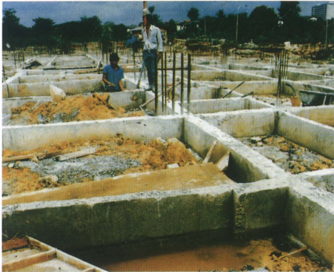
Tempat Pembiakan Nyamuk Aedes di Tapak Pembinaan (Contoh 1)

ABATE 500E sesuai untuk disemburkan pada permukaan air takungan di tapak pembinaan bangunan, parit atau tangki air kumbahan.