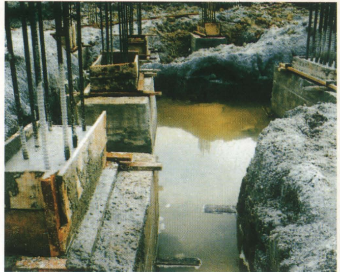
Tempat Pembiakan Nyamuk Aedes (Contoh 2)